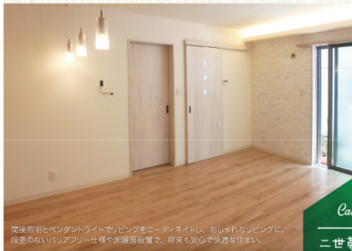
間接照明とペンダントライトでリビングをコーディネートし、おしゃれなリビングに。 段差のないバリアフリー仕様や床暖房設置で、将来も安心で快適な住まい。

幸せで心地よい暮らしは、人それぞれ。 住まいづくりの職人が住み心地やデザインを考え、 ご家族に合わせてご提案いたします。