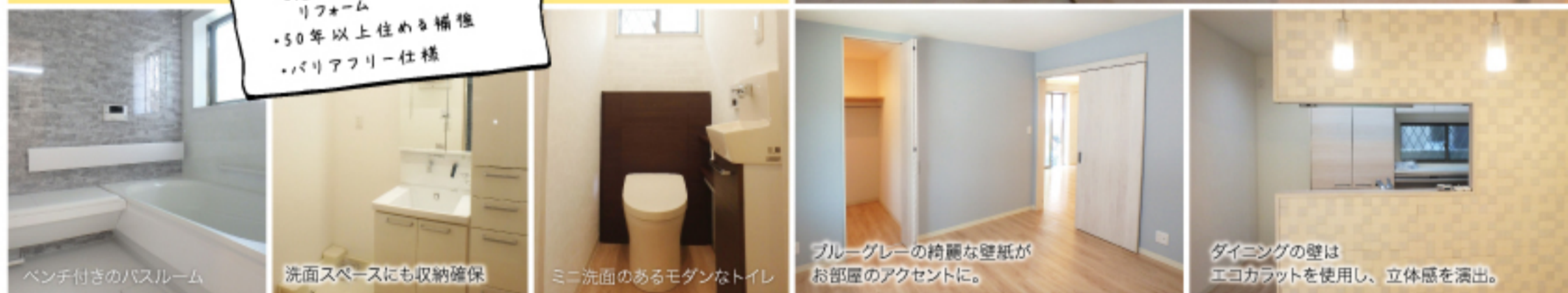
ベンチ付きのバスルーム