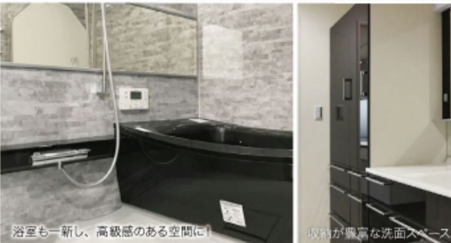
浴室も一新し、高級感のある空間に!

TOTO ザ・クラック フラット対面型(アイランド) / 人工大理石カウンタースクエア / オペり台シンク / 食器洗い乾燥機付