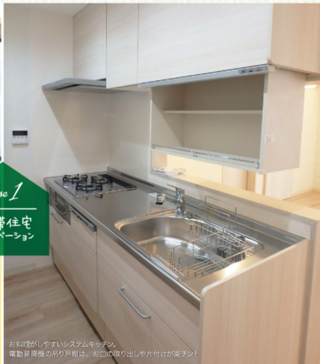
お料理がしやすいシステムキッチン。 電動昇降機の吊り戸棚は、お皿の取り出しや片付けが楽チン!